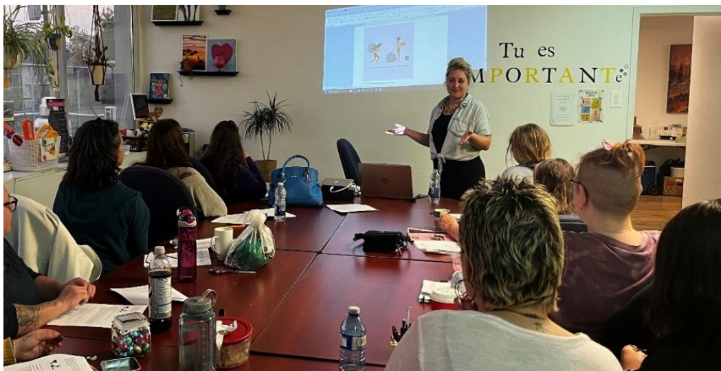
Animation d'un atelier thématique de groupe